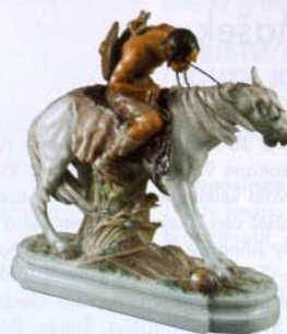
Indián na koni, Míšeň, počátek 20. století, porcelán

Řadou pozoruhodných výsledků skončila 16. října aukce brněnského aukčního domu Zezula. Zejména v oblasti kvalitních nábytků a starožitností se některé položky dostaly vysoko nad vyvolávací ceny. Například francouzská komoda „A Fleurs“ z doby Ludvíka XV., jejíž cena z vyvolávací ceny 100 tisíc docílila 483 tisíc korun. Velká poptávka byla po židlích a nábytcích epochy biedermeier. Mezi sklem a porcelánem se našla řada zajímavých kusů. Pár hyalitových flakonů (jižní Čechy, kolem 1835) se vydražilo za 86 tisíc korun (vyvolávací cena 50 tisíc) a cestovní pohár z čirého skla (severní Čechy, první třetina 18. století) byl zakoupen za 47 tisíc (vyvolávací cena 34 tisíc). Porcelánu vévodil míšeňský Indián na koni, za kterého zaplatil nový majitel 47 tisíc korun. Největší cenové nárůsty však zaznamenala kolekce starých cínových předmětů, zejména až příliš skromně ohodnocená kolekce z 18. století. Dvě cínové holby z vyvolávací ceny 3900 a 1900 vylétly na 23 tisíc, respektive 22 tisíc korun, jedna cínová lahev na kořalku z 800 na 16 100 korun. Nejdražším obrazem se stala anonymní francouzská malba na dřevě Tři puttí (2. polovina 18. století), vydražená za 92 tisíc korun. Zájem byl o práce Františka Tichého, grafiky Josefa Čapka, Cyrila Boudy, T. F. Šimona a mnoha dalších. Největší překvapení připravilo P. F. Toyen z roku 1945, jehož cena se vyšvihla z pouhých 900 na 46 tisíc korun.