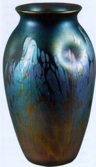
Váza Loetz, Klášterský Mlýn, 1902, sklo s irizovaným dekorem