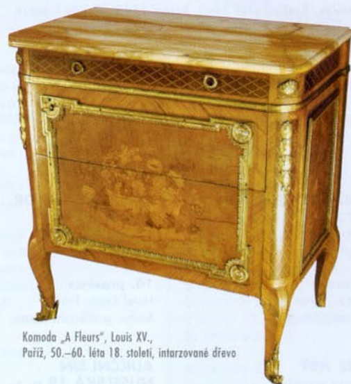
Komoda „A Fleurs“, Louis XV., Paříž, 50.–60. léta 18. století, intarzované dřevo

Aukční dům Zezula – Nábytek, starožitnosti, umění – Brno 16. 10. 2004