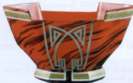
Žardiniéra, Polubný, Josef Riedel, po roce 1900, sklo